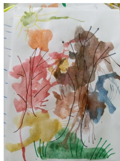
Евко София, 7 лет