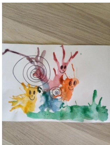
Горянская Кира, 6 лет

Что показалось вам сложным в выполнении работы?