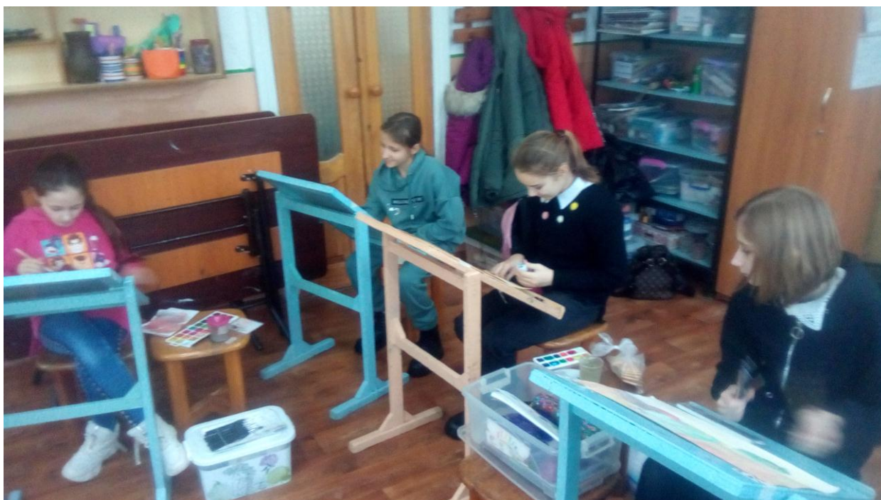
Фото проведения занятия