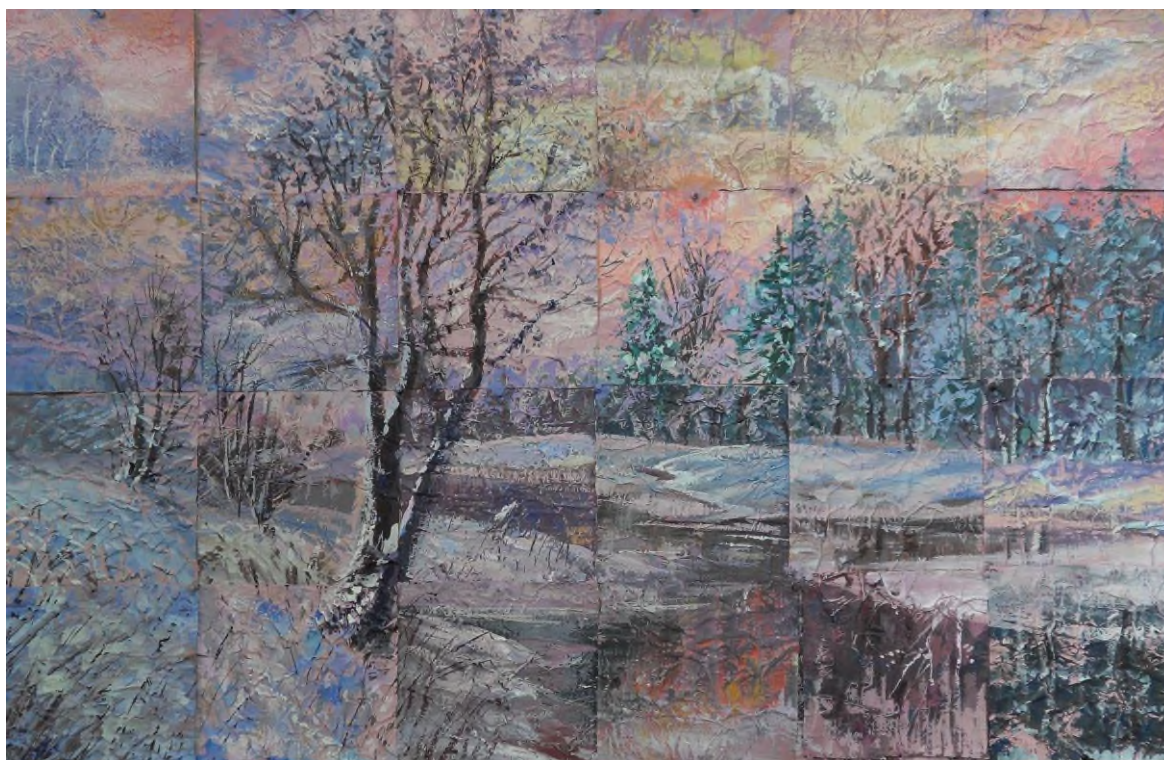
Ли Ксения, 9 лет.

После того, как все ребята справились со своими маленькими композициями, оформляем на стенде общую работу. Это самый интересный и интригующий момент для всех, так интересно посмотреть, что же в итоге получилось.