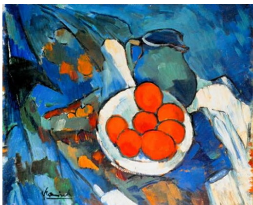
А. Матисс “Яблоки на столе”

Декоративный натюрморт – не менее известный жанр. Он создавался в конце 19 – начале 20 веков. В нем работали большие мастера (А.Матисс, П.Пикассо, И.Машков, Н.Гончаров, А.Куприн и т.д.) Несмотря на то, что многие художники этой эпохи писали в разной манере, все их произведения можно в одинаковой степени считать декоративными. Взять хотя бы произведения известного художника-экспрессиониста Матисса, в которых автор сделал главное ударение на фактуру и цвет. Декоративность его великолепных натюрмортов не вызывает никакого сомнения. Повышенное внимание к цвету и его акцентирование характерно и для произведений Фалька, Кончаловского, Грабаря, Антиповой. Декоративный натюрморт, полностью соответствующий термину в изображениях простых геометрических форм на картинах яркого представителя кубизма Пабло Пикассо.