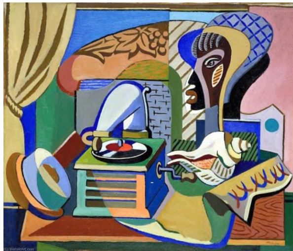
“Натюрморт с плетеным стулом”