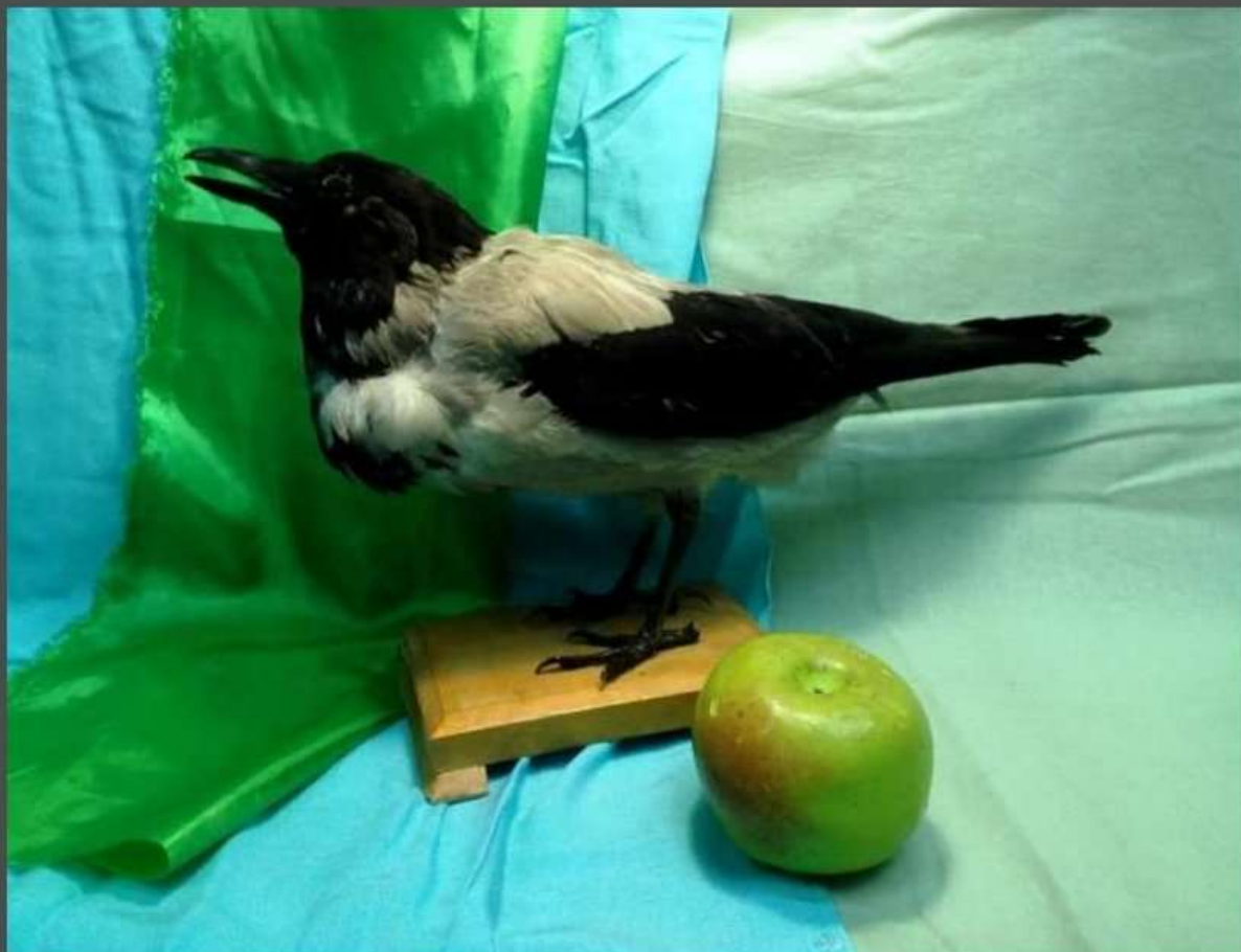
Фото натюрморта с чучелом птицы

Работа ведется легким касанием карандаша, при этом начинаем общими наметками места расположения предметов с учетом масштаба и пропорций будущих предметов. После выполнения предварительного рисунка, нужно начинать в цвете. В ходе работы следует всё время следить за характером светотеневых изменений тёплых и холодных цветов, стараться уловить разницу между ними.