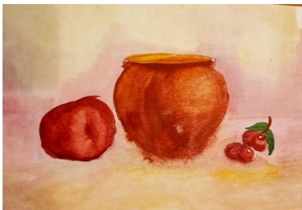
Фото работ выполненные учениками 2 класса «Живопись».